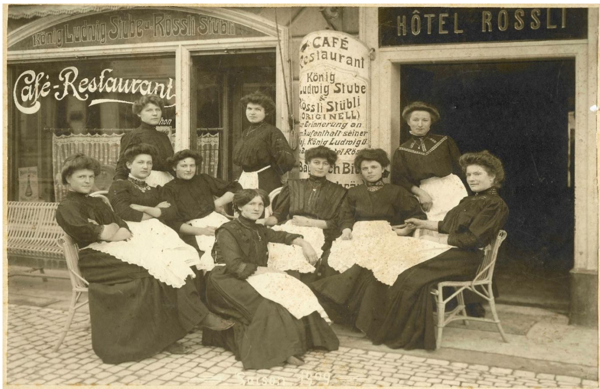
Weisses Rössli Brunnen Saison 1909

L'histoire est particulièrement vivante ici, en Suisse centrale, où la Confédération suisse a été fondée. Dès 1559, l'auberge « Weisses Rössli » est mentionnée pour la première fois. En 1865, le roi Louis II de Bavière séjourna à l'hôtel « Weisses Rössli », d'où il voulait découvrir le pays de Guillaume Tell et le Grütli. Brunnen était un point de départ idéal.