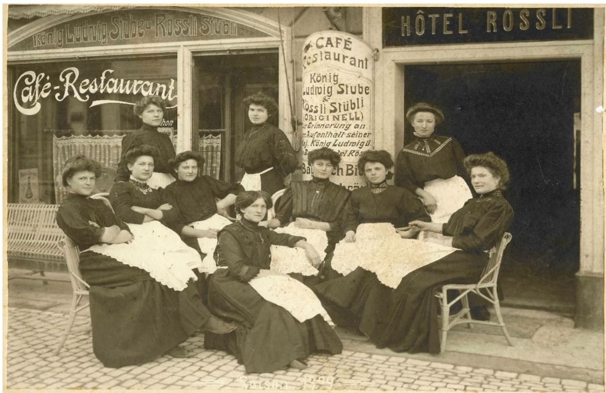
Weisses Rössli Brunnen Stagione 1909

La storia è particolarmente viva qui nella Svizzera centrale, dove è stata fondata la Confederazione. Già nel 1559 fu menzionata per la prima volta la locanda "Weisses Rössli". Nel 1865, il re Ludovico II di Baviera soggiornò alla locanda "Weisses Rössli", da qui volle vivere la terra di Guglielmo Tell e del Rütli. Brunnen è stato un punto di partenza ideale.